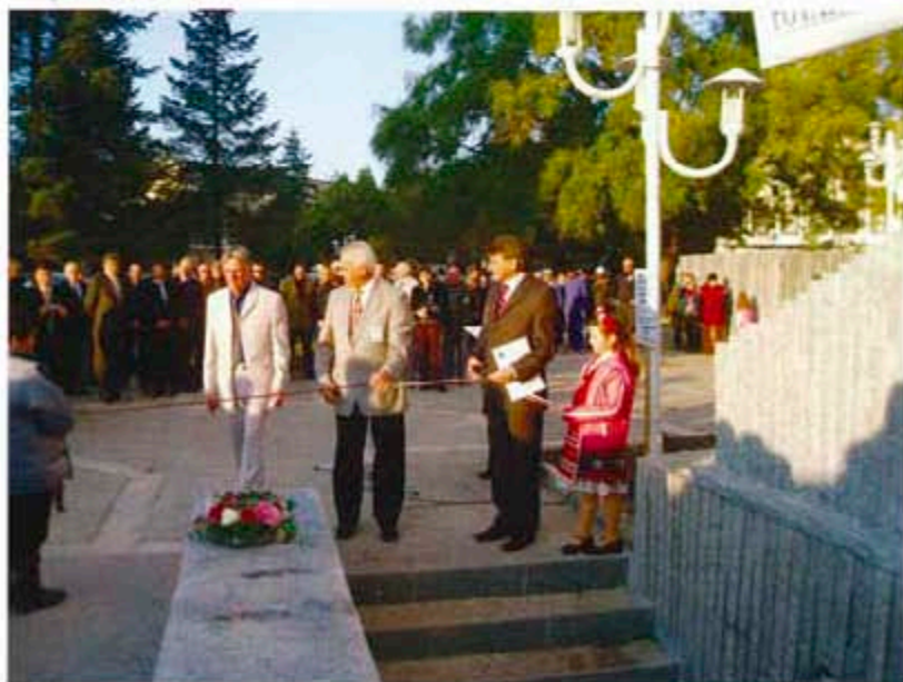
Тържествено прерязване на лентата на новата чешма