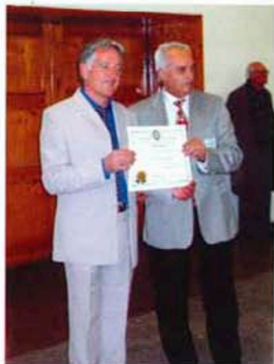
Връчване на хартата на РИ