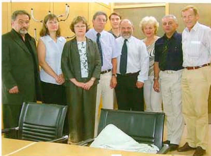
С кмета и президента на РК Бад Пирмонт

мационната част на гостуването. Имахме възможността да разгледаме замъка Хамелштенбург, като водач ни бе лично собственичката му, на